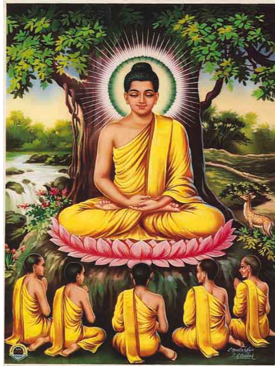
CHUYỆN PHÁP LUÂN TẠI VƯỜN LỘC GIẢ